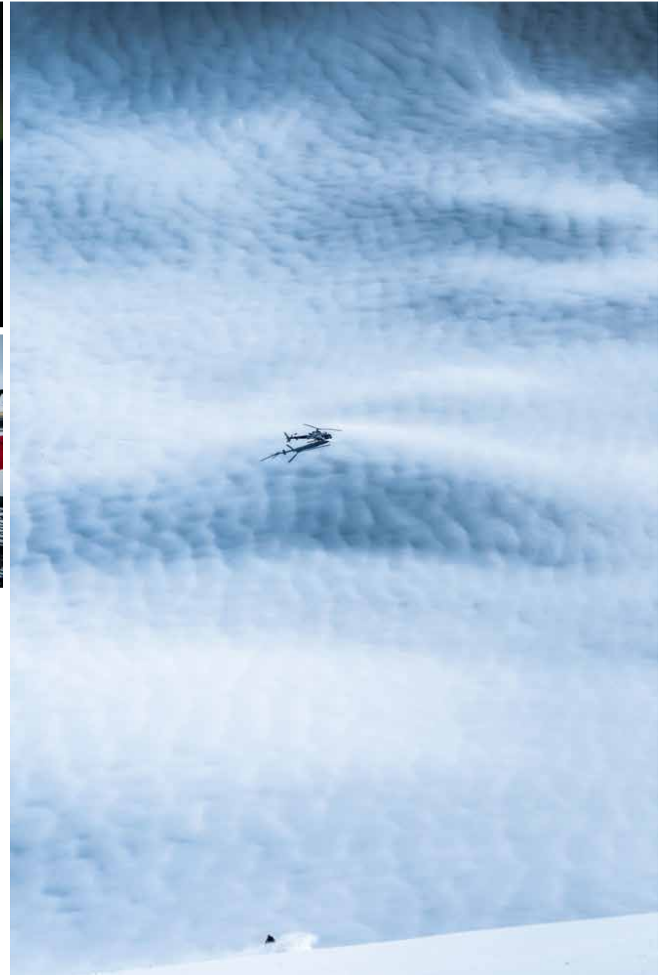
Rechts: First tracks op weg naar de heli die al klaar staat voor de volgende run.