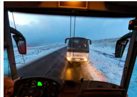
Terwijl de bergpas officieel gesloten is vanwege de sneeuwstorm, rijdt de chauffeur door.