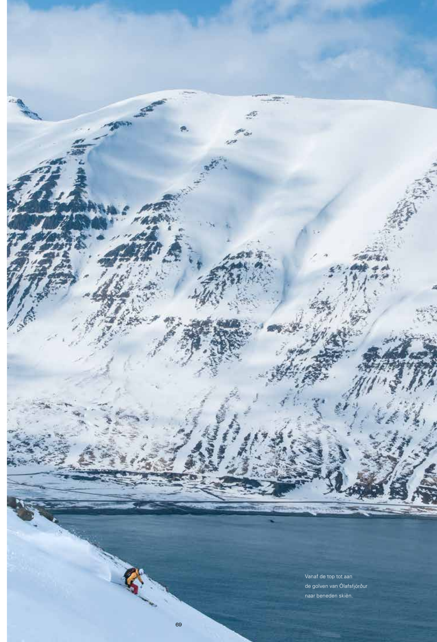
Vanaf de top tot aan de golven van Ólafsfjörður naar beneden skiën.

En als echte toeristen, is er ook voor ons geen ontkomen aan een bezoek aan de Blue Lagoon. Toeristisch is het zeker, maar de rit naar de lagune toe is al de moeite waard en eenmaal in het warme water zet je je toch wel makkelijk over het toeristengehalte heen.